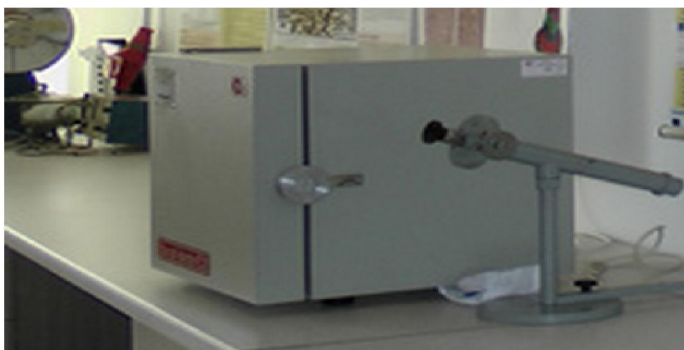
Etuvă tip EC25