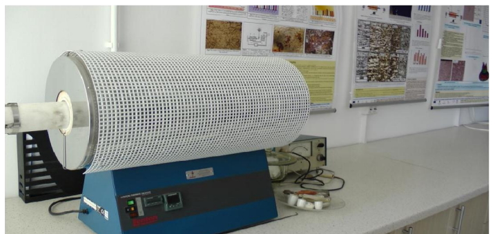
Cuptor electric LENTON